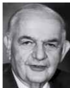
Alfred Grosser

Alfred Grosser stellt seine Analyse Europas nach dem Nein Frankreichs zur europäischen Verfassung vor: »Es bremst, aber zerstört weder die europäischen Menschenrechte noch deren Gericht. Die Werte mit und ohne Gott sind heute in Europa weitgehend die gleichen, vor allem weil sich die Kirchen verändert haben. Das ›Gott mit uns‹, den zürnenden Gott, der den Feind strafen wird, gab es 1914. Heute liegt es in Washington. Aber die Selbstüberschätzung der Kirchen und die Verniedlichung ihrer Vergangenheit gibt es in Deutschland mehr als in Frankreich - und vor allem in Rom.« • Alfred Grosser, geb. 1925 in Frankfurt a. M., 1933 Emigration nach Frankreich, seit 1937 französischer Staatsbürger, im 2. Weltkrieg in der Résistance, 1955-1992 Professor für politische Wissenschaften in Paris, Präsident des CIRAC (Centre d'information et de recherche sur l'Allemagne contemporaine), Friedenspreisträger des deutschen Buchhandels. ■