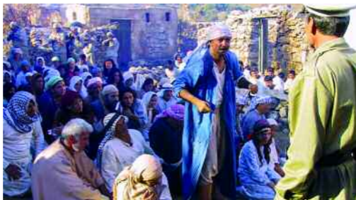
RAUM. Orte der Kunst