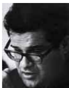
Konrad Wolf, 1965

In Konrad Wolfs Biographie spiegelt sich beispielhaft deutsche Geschichte: Exil in Moskau, Soldat der Roten Armee, international beachteter Filmregisseur, Kulturfunktionär. Immer wiederkehrende Themen seiner Filme waren Nationalsozialismus und Antisemitismus sowie die Beziehungen von Deutschen und Russen. Vor allem aber bewegte ihn die Frage nach dem Verhältnis von Kunst und Macht. Als langjähriger Präsident der Akademie der Künste sah sich Konrad Wolf immer als Mittler zwischen den Künstlern und den Mächtigen der DDR. |