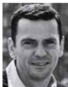
Christian Petzold

Im Drehbuch eines Films sind die Räume bloße Phantasie. Erst wenn die ästhetischen Kriterien der Regie mit denen der zuarbeitenden Departments zusammentreffen, wenn Drehorte ausgewählt, Settings konzipiert, Bauten ausgeführt und Kamera-Operationen festgelegt sind, wird konkret, was Räume zu filmischen Räumen macht. Wie dieser Prozess sich vollzieht, wie Orte sich zu Schauplätzen verdichten, stellen die Filmregisseure Christian Petzold aus Deutschland und Yousry Nasrallah aus Ägypten in Lectures zu ihrer Arbeit vor. • Informationen unter www.adk.de/raum ■