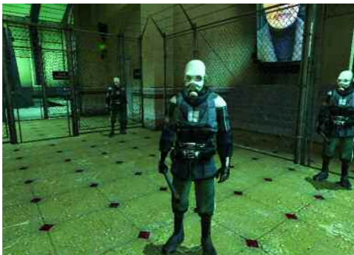
RAUM. Orte der Kunst