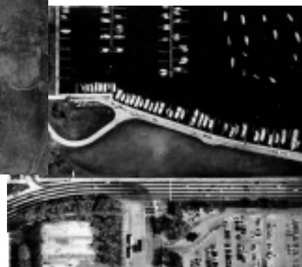
Charles & Ray Eames: Powers of 10 (1977)